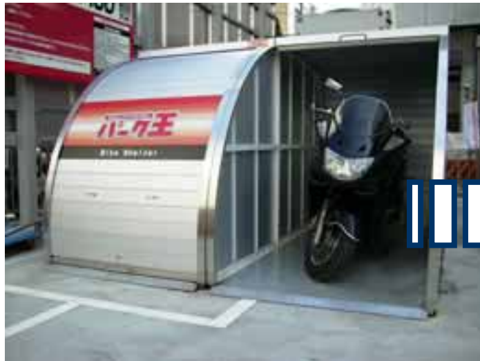
【月極】シェルタータイプ