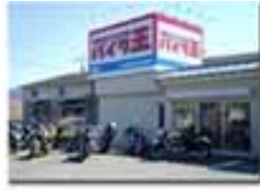
MS型 甲府店 3/16 OPEN