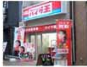
SS型 小倉店 4/16 OPEN