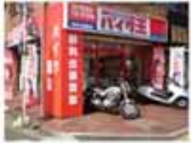
MS型 中村公園前店 3/1 OPEN