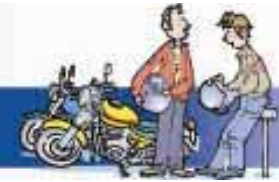
MS型 中村公園前店 3/1 OPEN