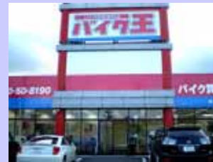
RS型 宇都宮店 6/1 OPEN