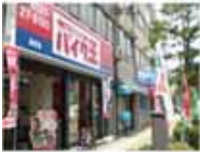
MS型 長崎店 4/16 OPEN