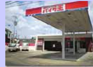
RS型 滋賀店 6/1 OPEN