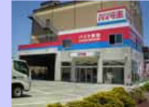
RS型 戸田店 6/16 OPEN