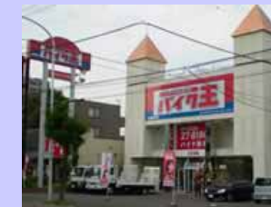
その他、MS型 高松店 7/16 OPEN