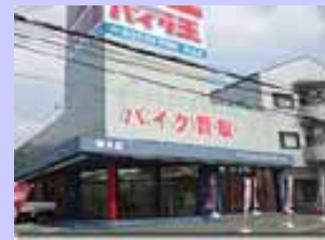
RS型 奈良店 6/7 OPEN