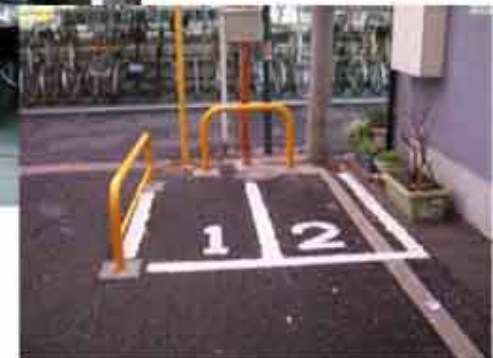
【月極】ラインタイプ