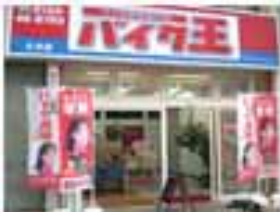
MS型 大分店 4/16 OPEN