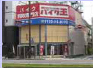
MS型 高知店 6/20 OPEN