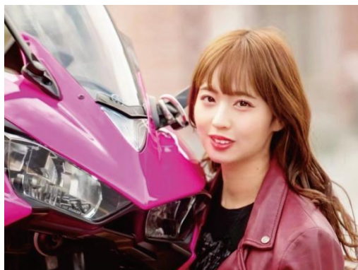
バイク王公式アンバサダー 奥沙織