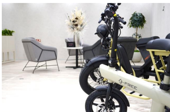
電動モビリティの展示